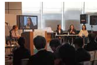
キックオフシンポジウム TV放映されました