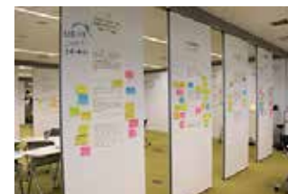
百人百様×サイエンス 研究シーズと多数のコメント