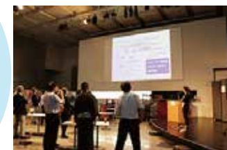
ダイバーシティ交流会 協議会内外に波及効果