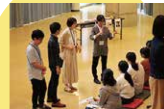
公開講座 理系先輩との交流