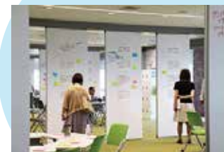
百人百様×サイエンス 130人がご来場!