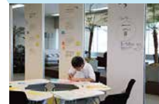
百人百様×サイエンス 熱心にコメントを書く来場者