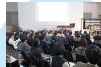
キックオフシンポジウム 多くのご参加がありました