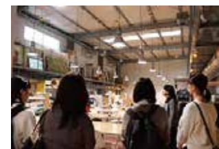
次世代育成 キャンパスツアー